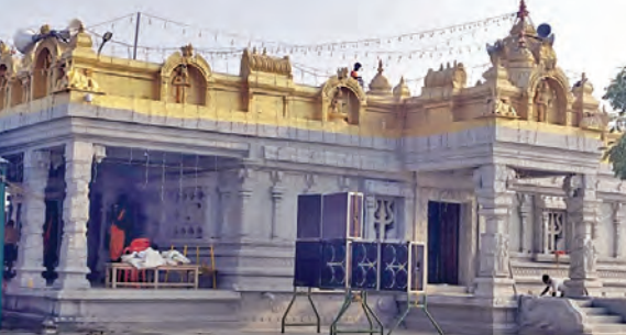
శ్రీకోడెల రాయస్వామి వారి ఆలయం