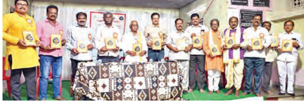
వేద విజ్ఞానమ్ గ్రంథాల ఆవిష్కరణ సభా దృశ్యం

విజయవాడ, మే 3 ప్రభాతవార్త ప్రతినిధి: కూలమి ప్రభుత్వం పచ్చి రెండేళ్లలోనే కాలువల నిర్వహణ పనులకు రూ.1100 కోట్లు అన్నిసార్లు జలవనరుల శాఖ మంత్రి నిమ్మల రామానాయుడు స్పష్టం చేశారు. ఈ సందర్భంగా కూడా కాలువల నిర్వహణ, తూడు, గుర్రపడకల్ తొలిగింపు, గేట్లు, పట్టణ మండలాలకు వంటి పనులు చేపట్టేందుకు రూ.397 కోట్లు మంజూరు చేసినట్లు మంత్రి కార్యాలయం నుంచి ప్రకటన విడుదలైంది. మళ్ళీ పంట కాలం మొదలయ్యే లోగా కాలువల పూడిక తీత, ఇతర అత్యవసర పనులన్నీ పూర్తి చేయాలి. ఆ మేరకు వెంటనే పనులు ప్రారంభించాలి. ఓపిష్టం ఇంజనీర్ నుంచి కిందిస్థాయి అధికారుల వరకు అందుకు అవసరమైన చర్యలు చేపట్టాలి. రూ.10 లక్షల లోపు పనులు సాగునీటి సంస్థలు అధ్యక్షులలో నామినేషన్ పద్ధతిలో అప్పగించాలి. రూ.10 లక్షలు దానిన పనులకు స్వల్పకాల బెండ్ల పిలిచి పనులు అప్పగించాలి. గేట్లు, పట్టణ వంటి మెకానికల్ పనులు తప్పనిసరిగా ఆన్ స్టాండ్ ఇంజనీర్ పరిశీలించి సరకుగా పని చేసే స్థితిలో ఉన్నాయనే ప్రమాణికం పత్రాన్ని ఓపిష్టం ఇంజనీర్ కు ఇవ్వాలి అని మంత్రి నిమ్మల రామానాయుడు పేర్కొన్నారు.