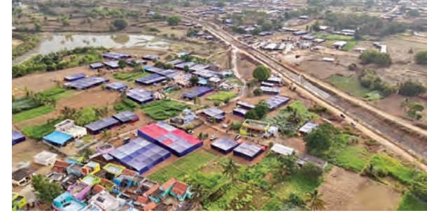
జాతరకు వచ్చిన భక్తులు భారీగా వేసకున్న గుండాలూ